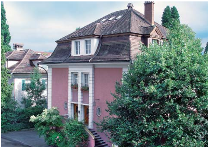
Tierklinik Obergrund in Luzern.

Ein zotteliges Etwas erscheint plötzlich in der unteren Hälfte des Türrahmens und scannt mit pechschwarzen Knopfaugen das Wartezimmer. Der Golden Retriever und seine Besitzerin, eine Frau mittleren Alters mit blonden Haaren, schlurften zur Ecke des