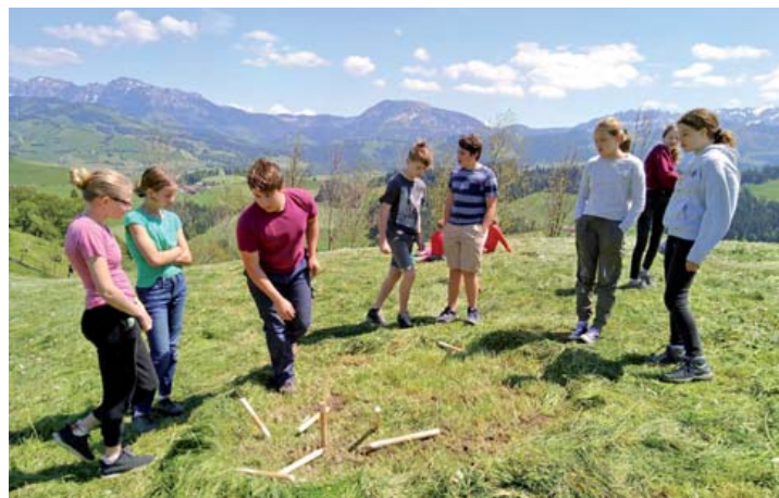
Lagerteilnehmende am «Chneble»

«Wir dachten, dass es kleiner ist und nicht so modern. Wir sind froh, das Programm mitbestimmen zu dürfen. Das hätten wir nicht erwartet. Das Lager ist sehr cool! Es sind unglaublich nette Leute hier vom Hof und wir haben es auch super untereinander. Die Nähe zu den Tieren ist schön und wir sind sehr frei, machen viele Spiele und sind manchmal zusammen am Handy. Wir können das Programm zusammen gestalten und helfen uns gegenseitig. Uns gefällt es, wir würden kaum etwas ändern.»