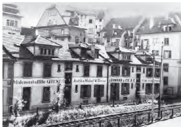
oben: Lebensmittel Toura, heute Plexihof