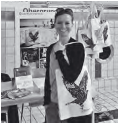
Zum Titelbild