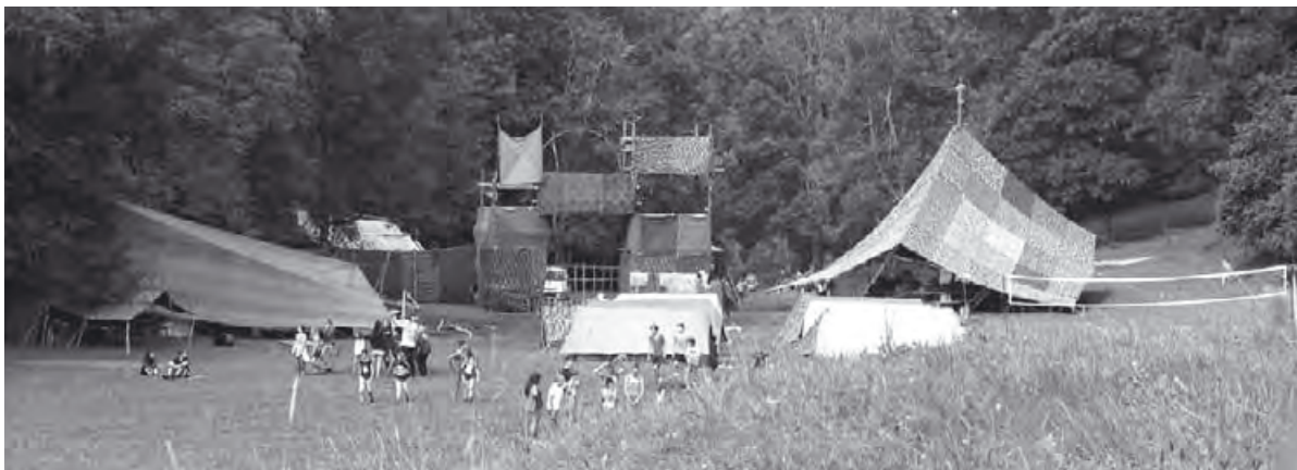
Jungwacht und Blauring St. Paul

Der Lagerplatz von Jungwacht und Blauring St. Paul in Soule/JU.