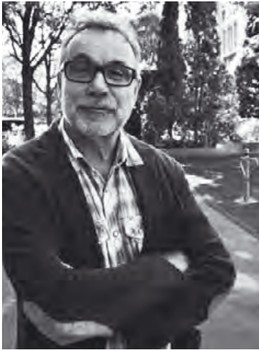
Zum Titelbild