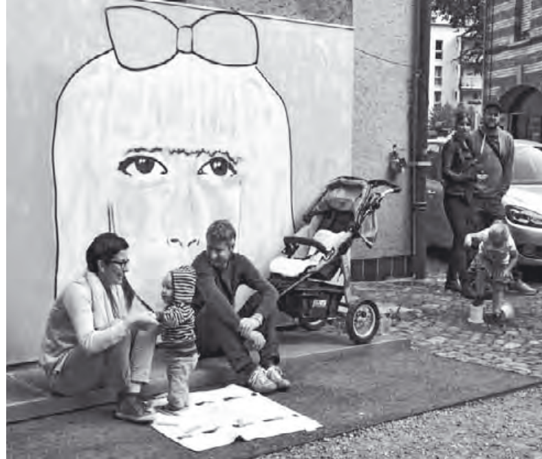
Impressionen vom diesjährigen Lindengartenfest